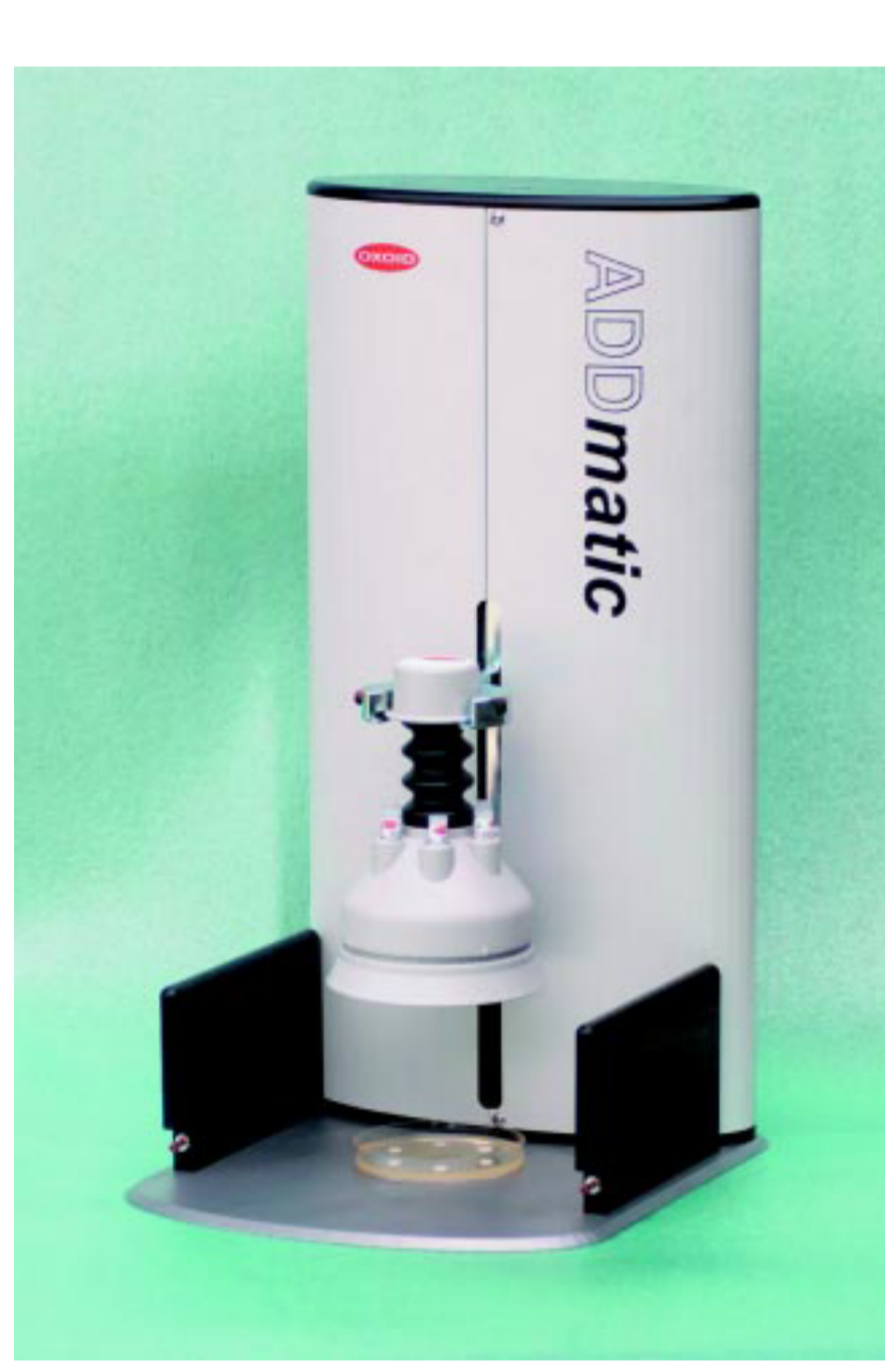
Figur 3. Et af de første tre apparater blev fremstillet i et samarbejde imellem IPU og AKS Finmekanik. Den første brugsperiode gav anledning til mindre tilpasninger, hvorefter produktion hos AKS Finmekanik begyndte.

Det er vigtigt, at et produkt signalerer, at det indeholder de væsentlige