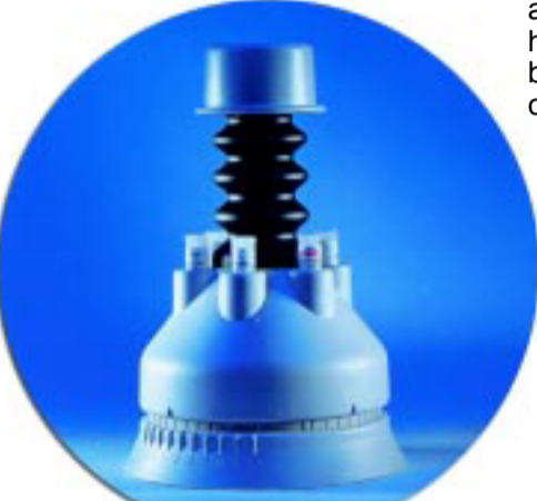
Figur 2. Den »gamle« håndbetjente dispenser, som mange laboratorier bruger.

Med den opstillede projektgruppe fik Amtssygehuset i Herlev en aftale med Erhvervsfremmestyrelsen om økonomisk støtte til projektet. De økonomiske rammer for det samlede udviklingsprojekt har væ-