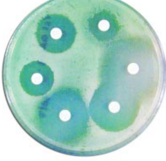
Figur 1. Petriskål med agarkultur og antibiotikaholdige discs. Væksthæmningszonerne rundt om discene ses tydeligt.

Når bakteriers følsomhed overfor antibiotika skal fastlægges benyttes en fremgangsmåde, hvor en agarplade tilsås med bakteriekultur, hvori der anbringes antibiotika-holdige discs. Afhængigt af bakteriernes resistens overfor den antibiotika som discen indeholder, vil der dannes større eller mindre væksthæmnings-zoner uden om discene. På figur 1 ses en petriskål indeholdende agarkultur og antibiotikaholdige discs. Væksthæmningszonerne rundt om discene ses tydeligt.